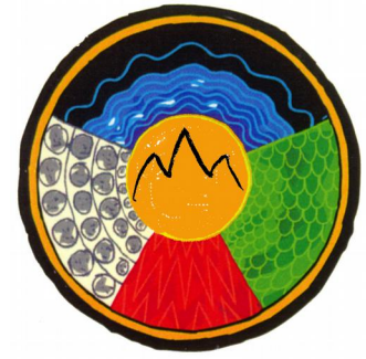
Medizinrad der Dagara

Die Faszination aller Formen von Aufstellungsarbeit liegt in ihrer emotionalen Wirkung auf die Beteiligten und im Schöpfen aus einem unbekanntem Wissen im Raum der Aufstellung. Auftauchen von Gefühlen und