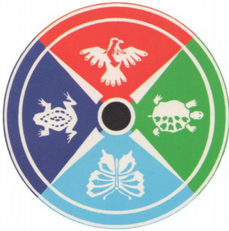
Medizinrad Bear tribe (Sun Bear)