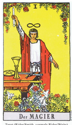
Tarot (Rider/Smith, vormals Rider/Waite)